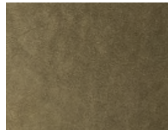
M328 Ottone anticato | Aged brass | Laiton vielli | Altmessing | Latón envejecido | Состаренная латунь