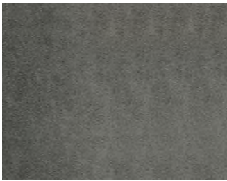
M326 Argento naturale | Natural silver | Argent | Silber natur | Plata natural | Натуральное серебро