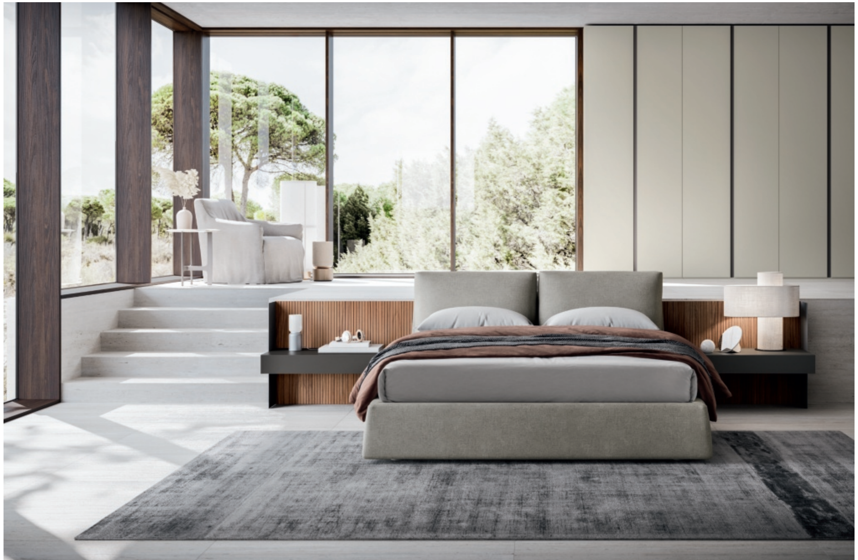
Milano 2 letto / bed Tessuto Nina 39 / Nina 39 fabric L/W184 P/D234,8 H94,3