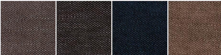
YUC Col 36